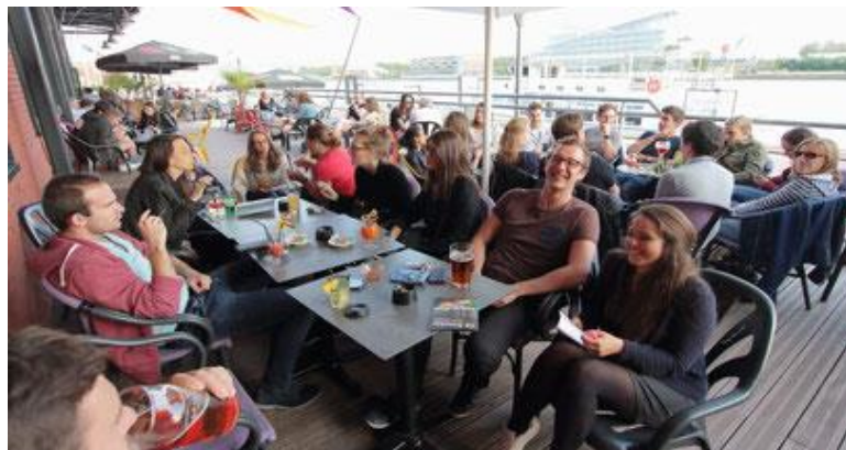
Petit verre sur les quais – Juin 2018